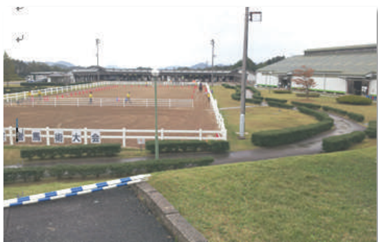
第 22 回全国障害者馬術大会が開催された馬場

かなぎライディングパークは、島根県浜田市市街地から南東約 30km 離れた金城町の中山間地域にある乗馬施設で、平成 25 年にリニューアルオープンした。広大な敷地内にレストランを含むクラブハウス、覆い馬場、厩舎、馬場が機能的に配置され、外乗ができるコースもある本格的な施設である。