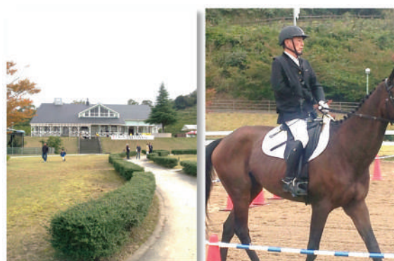
レストランや多目的ルームがあるクラブハウスの遠景（左）と馬術競技出場選手（右）

「全国障がい者馬術大会」は、平成5年に全国障がい者交流乗馬大会として明石乗馬協会が初めて実施している。第22回大会（平成26年）は、パラリンピックを念頭において企画されたこともあり、参加団体14、知的障がい選手40名、身